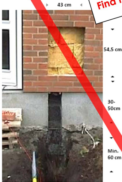
Udsparing, bredde min. 15 cm

Pr. 1. maj 2019 skifter vi til en ny type målerskab med andre mål. Find monteringsvejledningen på gasnet.dk/nytskab